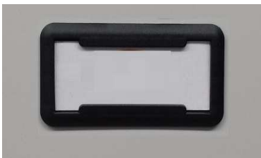
Porta cartellino in materiale plastico