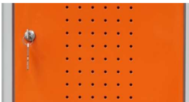
Ante provviste di fori di aerazione

Trattamento delle superfici: a mezzo fosfato di ferro pesante come preparazione alla verniciatura che avviene per elettrodeposizione anodica con spessore garantito in ogni parte del mobile. Reticolazione a forno a 180°. Vernici: acriliche con elevata resistenza alla corrosione secondo le norme A.S.T.M.B. 117.64 e succ.var.