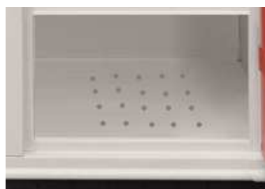
Vano inferiore porta scarpe con fondo zincato e areato