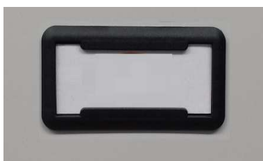
Porta cartellino in materiale plastico