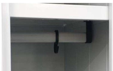
Appenderia interna in PVC