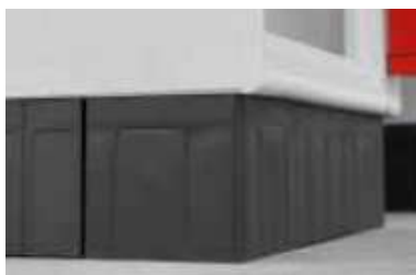
Zoccolo in polipropilene PP