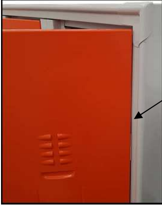
Cerniere interne anti scasso non visibili dall'esterno