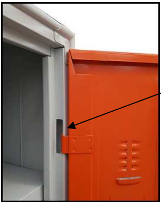
Cardine e perno di rotazione Interno